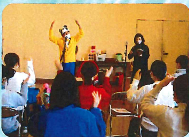
“体操とうたあそび”