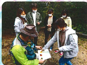
“しまっちの自然と遊ぼう”

他にも、いろいろな研修をしていますので、ぜひ、ご参加下さい！お待ちしております。