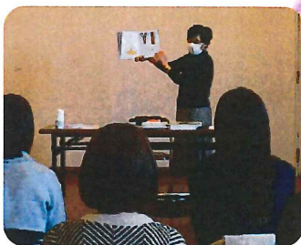
“おはなしに親しもう”

他園の先生たちとつながりながら楽しい時間を共有し、明日への保育向上につながることを願って、様々な研修を行っています。