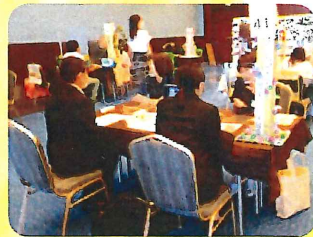
(去年度のフェアの様子)