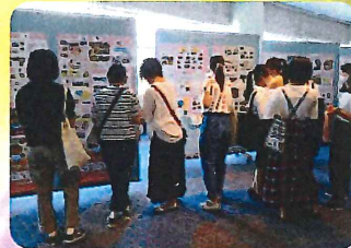
“アピールちらしコーナー”