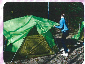
“わくわくキャンプ体験”